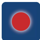
Оранжевый или красный свет становится видимым только при включении

Благодаря передовому интерференционному покрытию